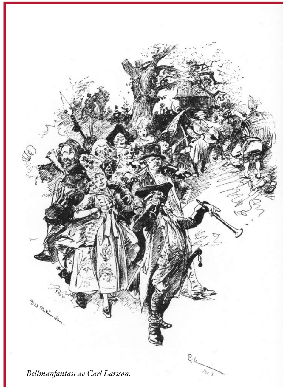
Bellmanfantasi av Carl Larsson.