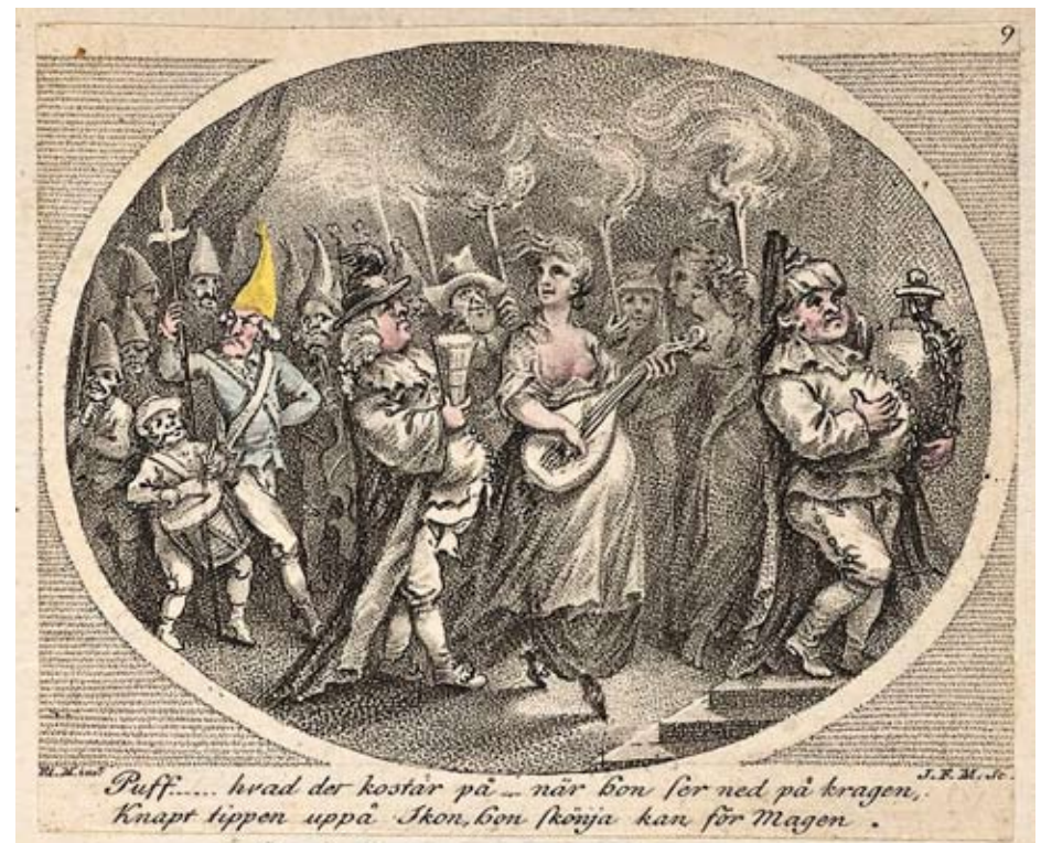
Den äldsta bilden av Bellmans skapelse "Ulla Winblad", höggravid, i "Bacchi Tempel" från 1783. Gravyr av Elias Martin och Johan Fredrik Martin. Kungliga Biblioteket.