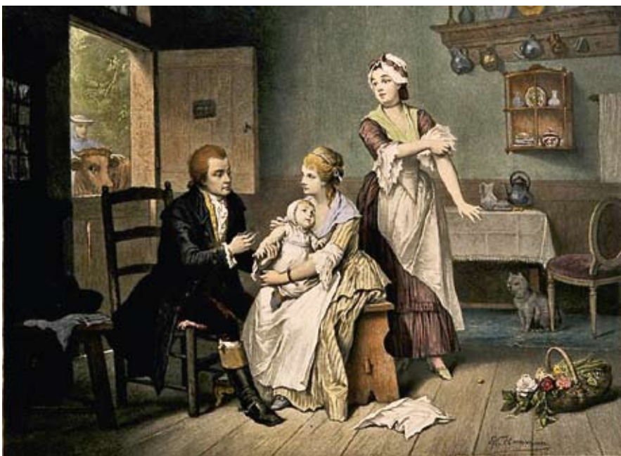
Doktor Edward Jenner skapade 1796 smittkoppsvaccinet utifrån ofarligt kokoppssekret. Här behandlar han sin elvamånaders son. Den räddande kon (lat. vacca) betraktar scenen genom fönstret.