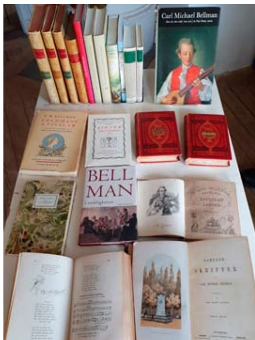
Ett urval av den Bellmanlitteratur som nu kan få nya ägare.