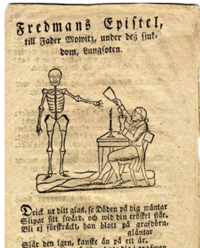
Fredmans epistel nr 30. Skillingtryck 1825.

En första länk som den intresserade bör bokmärka är Bellmans författarsida ( https://litteraturbanken.se/forfattare/BellmanCM ). Här förgrenar sig det di-