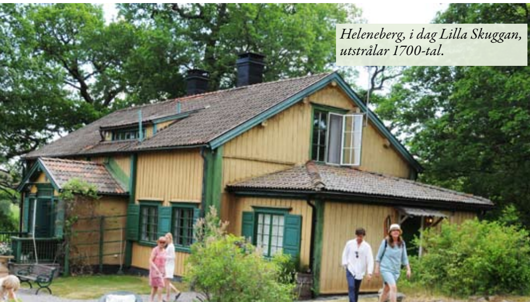
Heleneberg, i dag Lilla Skuggan, utstrålar 1700-tal.