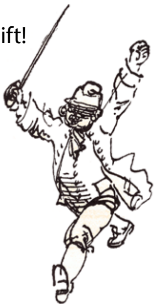
Teckning: Yngve Berg

Styrelsen arbetar ideellt, utan ersättning. För de riktigt stora projekten söker vi anslag, men allt det övriga förut-