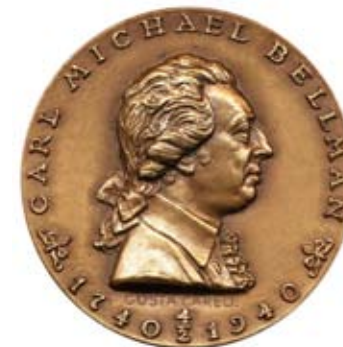
En av de 35 Bellmansmedaljerna. Konstnären Gösta Carell gjorde den till 200-årsjubileet 1940.

Utslagsfråga: I vilken årgång av Bellmansstudier kan man hitta en förnämlig medaljförteckning?