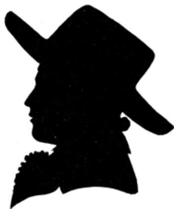
J.M Kraus. Självpporträtt.

Svar: På Tivoliparkens höjd vid Brunnsvikens östra strand ligger gravplatsen för den tyskfödde komponisten Joseph Martin Kraus (1756-1792). Han har kallats "den svenske Mozart" och till-