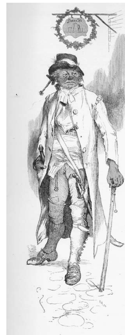
Cornelius Tratt skildras av fru Lenngren både i "Reflexion" och "Min salig man", här återskapad av Carl Larsson 1884.

Efterhand engagerades hon som översättare